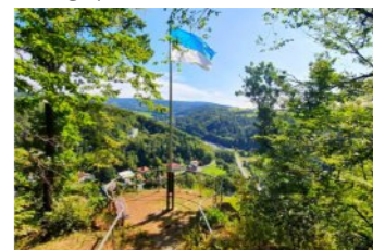
12-Rotherfelsen - „Fahne“